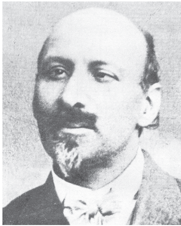
Հայաստան գալու առաջին տարիներին