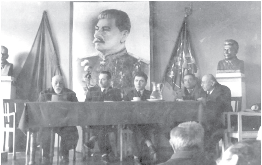
Ակադեմիայի նիստերից մեկը