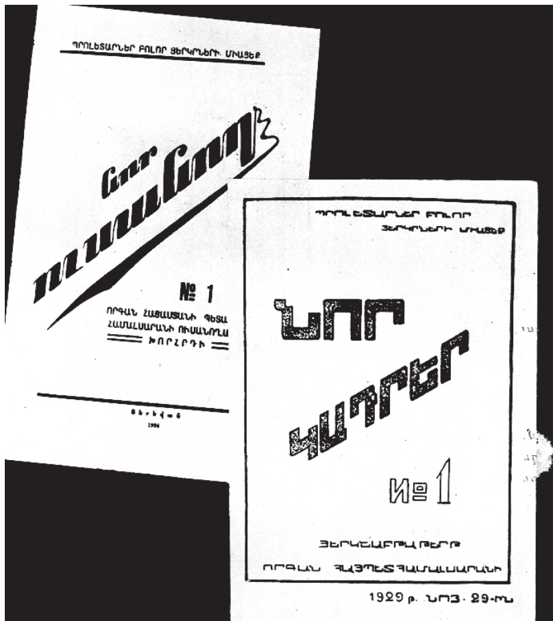
«Նոր կադրեր» երկչաբաթաթերթի և «Նոր ուսանող» ամսագրի անվանաթերթերը: