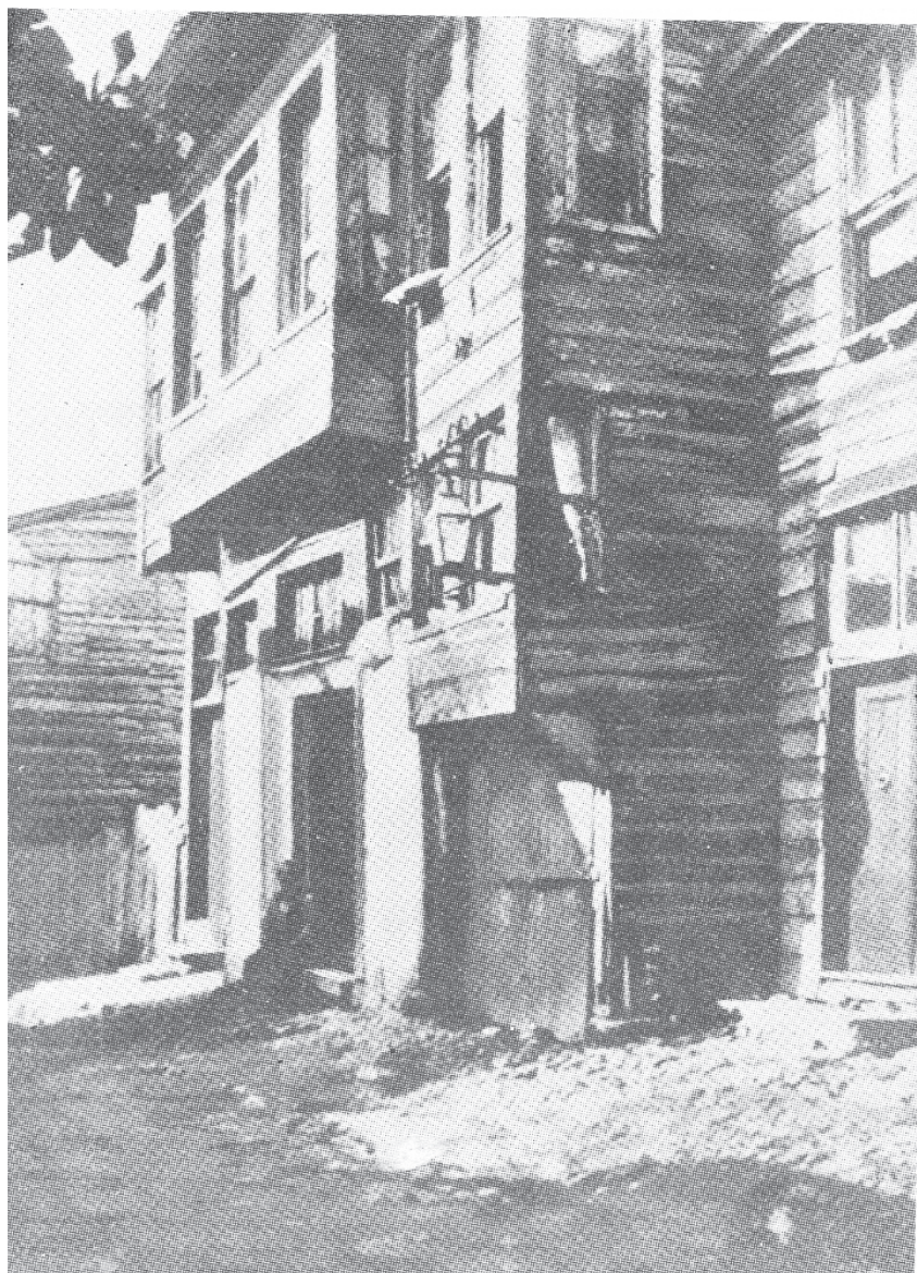
Այն տունը Կ. Պոլսում, ուր ծնվել է Հր. Աճառյանը