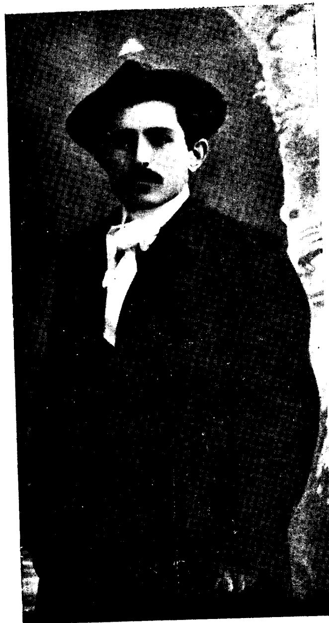
Վահան Տերյան (Թիֆլիս, 1908):