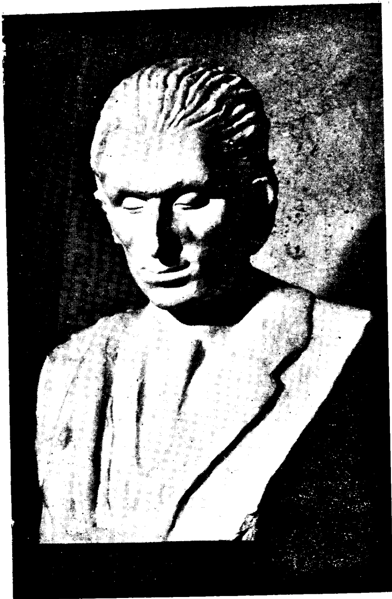
Վահան Տերյան: Կարծ Ե. Քոչարի (1918):