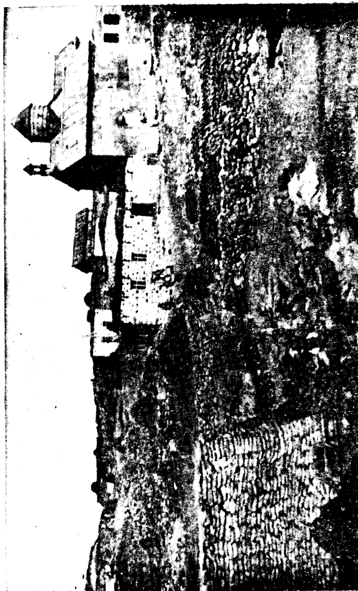
Գանձա գյուղի այն տունը, որտեղ ծնվել է վահան Տերյանը: