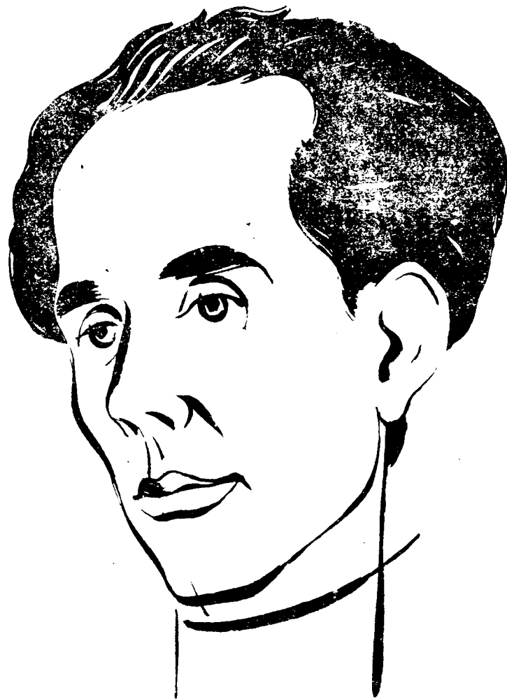
Ն. Ա. ՕՍՏՐՈՎՍԿԻ